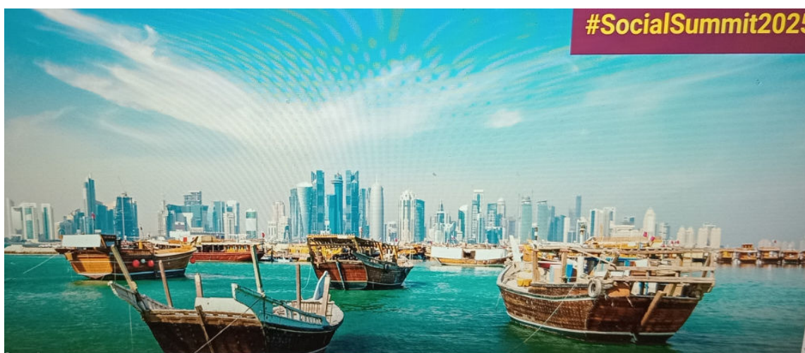
Accueil et réception des VIP pour le deuxième Sommet mondial pour le développement à Doha, Qatar

Le deuxième Sommet mondial pour le développement social s'est tenu à Doha, au Qatar, du 4 au 6 novembre 2025, marquant ainsi le 30e anniversaire du sommet historique de Copenhague. Les dirigeants du monde entier se sont réunis pour redéfinir les stratégies de progrès social, renforcer les partenariats internationaux et promouvoir des politiques inclusives favorisant l'égalité des chances pour tous. Plus de 14 000 personnes ont participé à ce sommet.