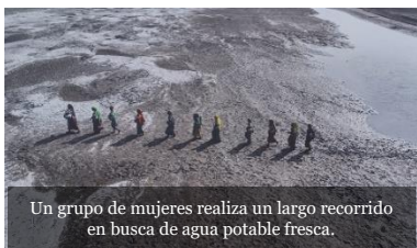
Un grupo de mujeres realiza un largo recorrido en busca de agua potable fresca.

Sonemos como una única humanidad, cada uno con la riqueza de su fe o de sus convicciones, cada uno con su propia voz, todos hermanos. (FT8)