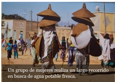
Un grupo de mujeres realiza un largo recorrido en busca de agua potable fresca.

Cada uno de nosotros está llamado a ser un artesano de la paz, uniendo y no dividiendo, extinguendo el odio y no conservándolo, abriendo las sendas del diálogo y no levantando nuevos muros. (FT 284)