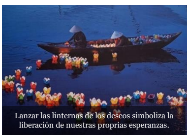
Lanzar las linternas de los deseos simboliza la liberación de nuestras propias esperanzas.

El camino es crear en los países de origen la posibilidad efectiva de vivir y de crecer con dignidad. (FT 129)