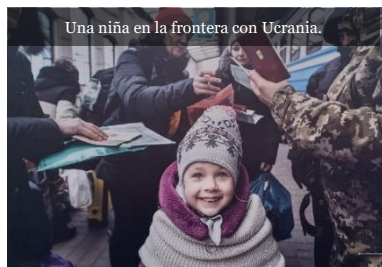
Una niña en la frontera con Ucrania.

Apreciar la riqueza y la belleza de las semillas de la vida en común que hay que buscar y cultivar juntos. (FT31)