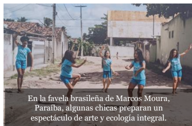
En la favela brasileña de Marcos Moura, Paraíba, algunas chicas preparan un espectáculo de arte y ecología integral.

En toda guerra lo que aparece en ruinas es el mismo proyecto de fraternidad, inscrito en la vocación de la familia humana. (FT 26)