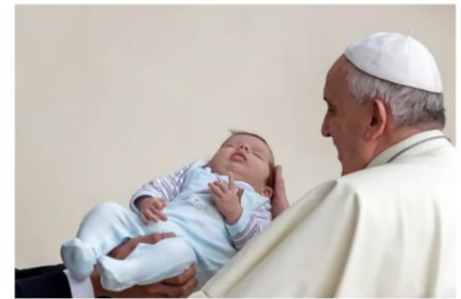
Pope Francis, pictured on Oct. 15, 2014.

“No puede haber paz sin una cultura del cuidado. Por lo tanto, la cultura del cuidado exige un compromiso común de apoyo e inclusivo para proteger y promover la dignidad y el bien de todas/os la voluntad de mostrar cuidado y compasión, trabajar por la reconciliación y la curación, y promover el respeto y la aceptación mutua. Como tal, representa un camino privilegiado hacia la paz. “En muchas partes del mundo se necesitan caminos de paz para sanar las heridas abiertas. También se necesitan constructores de paz, hombres y mujeres preparados para trabajar con audacia y creatividad para iniciar procesos de sanación y encuentro renovado.”