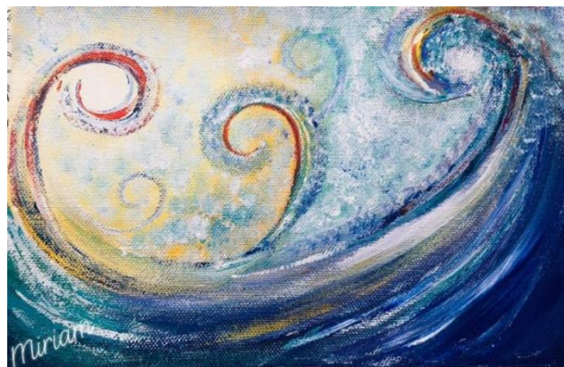
Pintura de Miriam Yu rscj

¿Cómo crees que la honestidad está fundamentalmente relacionada con proteger nuestro planeta?