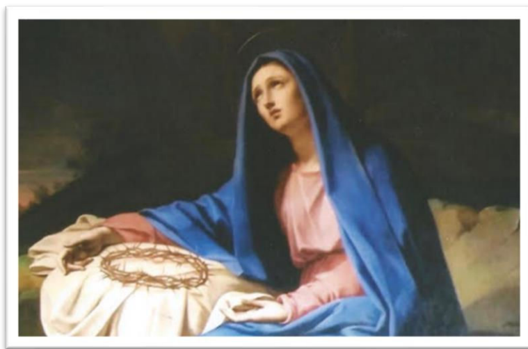
Nuestra Señora de los Dolores, Villa Lante, Rome

15 de septiembre - Fiesta de Nuestra Señora de los Dolores