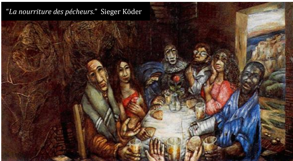
"La nourriture des pêcheurs." Sieger Köder

Le repas auquel Jésus vous invite est différent des autres ; la nourriture et la boisson qu'il nous offre, c'est lui-même, son corps et son sang sont la nourriture et la boisson du salut, du pardon, de la libération, et ils sont offerts à tous sans distinction. C'est une table pour tout le monde.