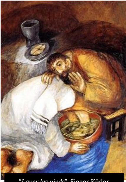
"Laver les pieds", Sieger Köder

Sa table et son Pain qui nous rassemblent sont un symbole d'unité ; avec Lui et en Lui nous sommes un avec le Père et entre nous. Cet amour unificateur et relationnel nous ouvre continuellement à quelque chose de nouveau et de révolutionnaire ; il nous fait découvrir une nouvelle dimension de l'Amour qui dépasse nos limites pour être amenés à l'extrême.