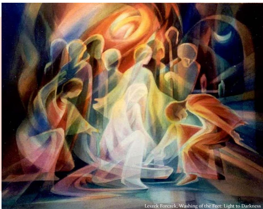
Leszek Forczek, Washing of the Feet: Light to Darkness